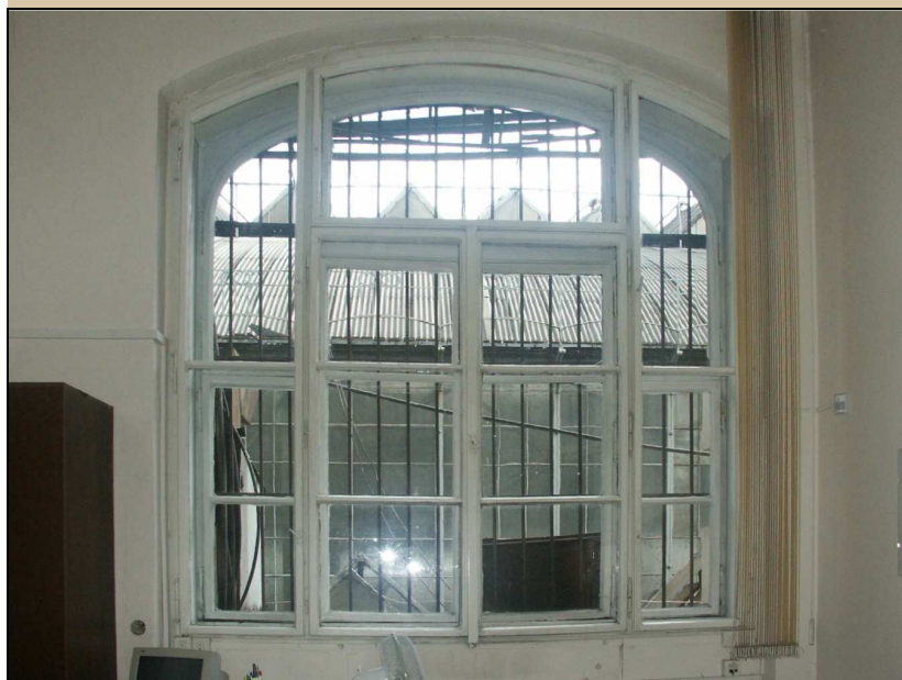
celkový pohled z interiéru