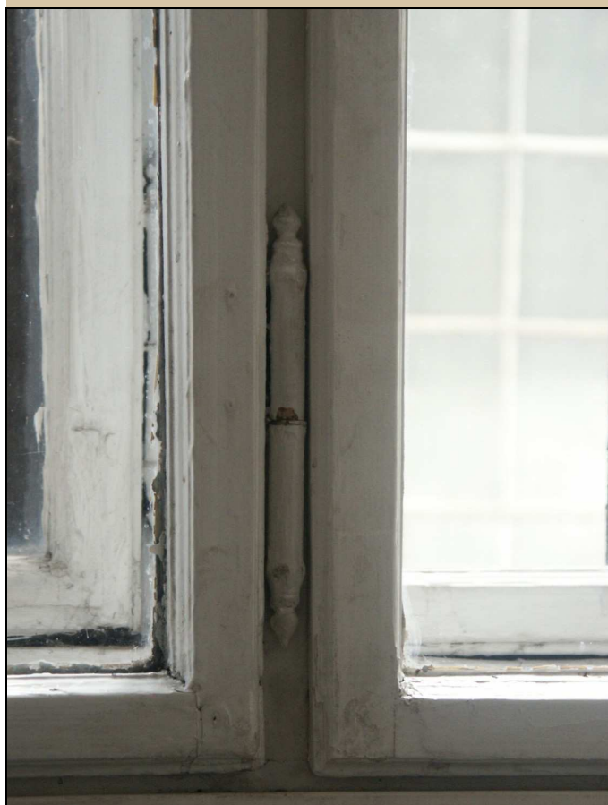
zapuštěný okenní závěs